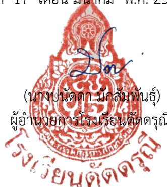
(นางชนัดดา มุกสัมพันธุ์) ผู้อำนวยการโรงเรียนดัดดรุณี

ประกาศ ณ วันที่ 17 เดือน มีนาคม พ.ศ. 2565